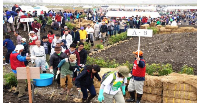
▲2015年7月(昨年)の植樹祭の様子