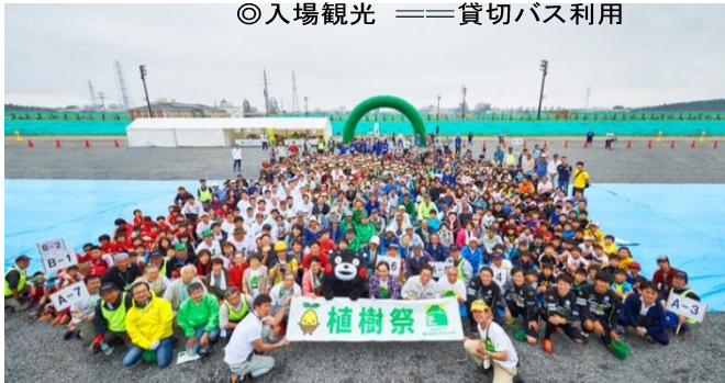
▲2015年7月(昨年)の植樹祭の様子